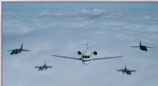
Falcon van het 21ste Smaldeel, geflankeerd door F-16's en Alpha Jets, 2007

Le livre sera aussi vendu aux mêmes conditions en version française. Veuillez noter “15 Wing FR ” sur votre virement.