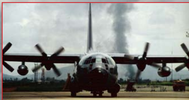
C-130 onder mortieruur te Kigali, 1994

Auteur erekolonel Piet Claes, zelf een op rust gestelde luchtmachtpiloot, werkte vele jaren aan deze studie. Dit boek geeft een duidelijk overzicht van ononderbroken inzet. Tevens krijgt men de achtergrond van het vertrouwd beeld dat al zestig jaar ons luchtruim beheerst: de Flying Boxcar en de Hercules, maar ook heel wat andere machines worden op een nooit geziene manier geïllustreerd met verhalen en afbeeldingen, afkomstig uit de herinneringen en albums van de vliegeniers en het grondpersoneel die samen een unieke geschiedenis schreven.